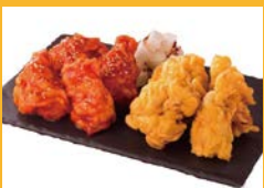
ニャムニャムチキン